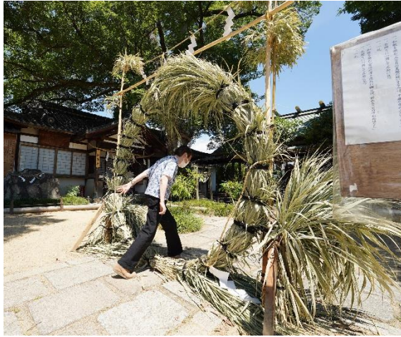
外出支援 (6/30 斎宮神社 夏越の祓)